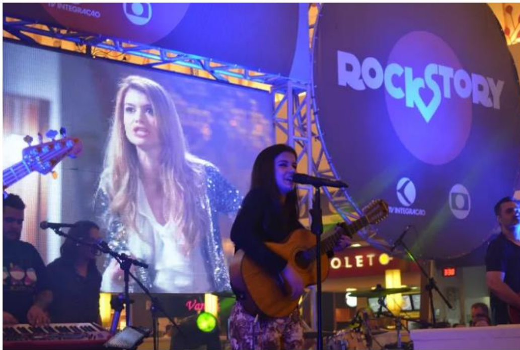
Representante do The Voice Brasil cantou 'Lulu Santos'