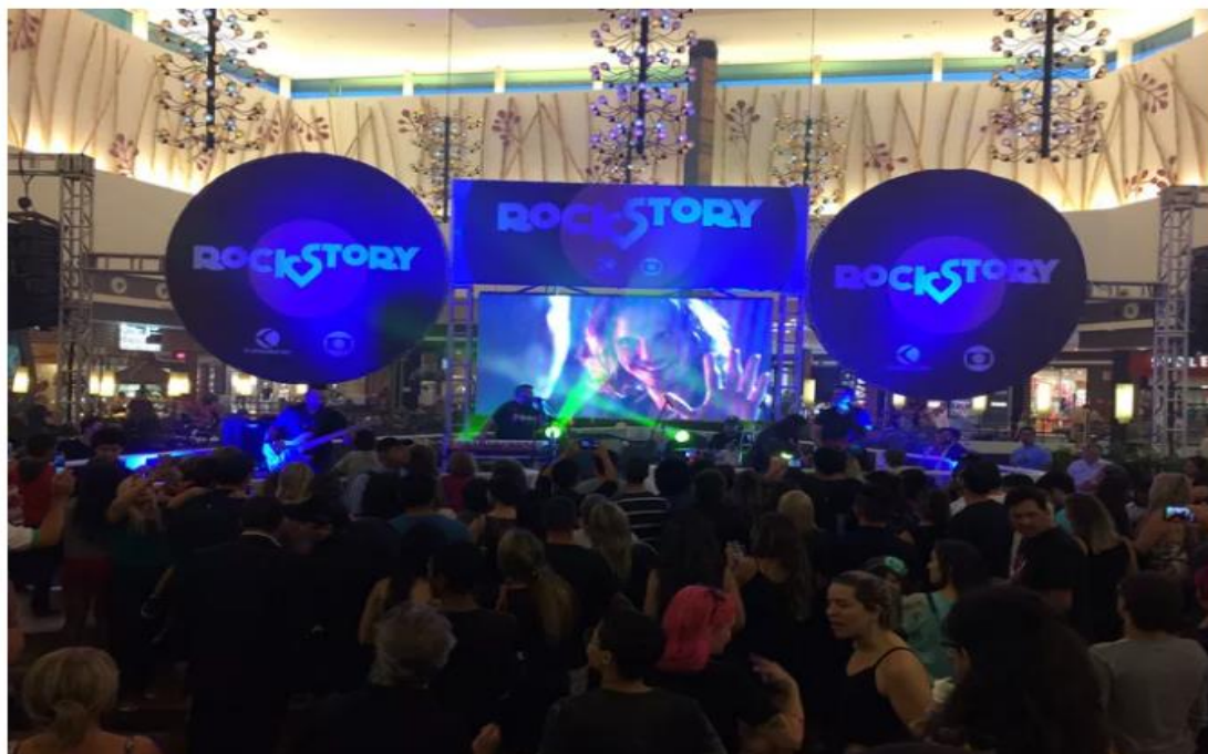
Evento foi realizado no Uberlândia Shopping

Público assistiu o primeiro capítulo da novela e curtiu show de rock and roll com a banda Venosa