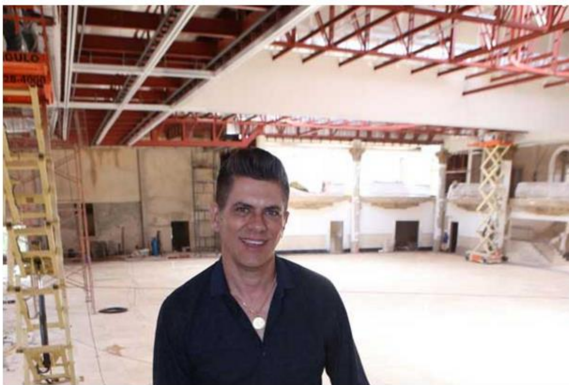
Segundo Rodrigo Carneiro, só nesse ano, o Palácio de Cristal teve mais de 630 contratos